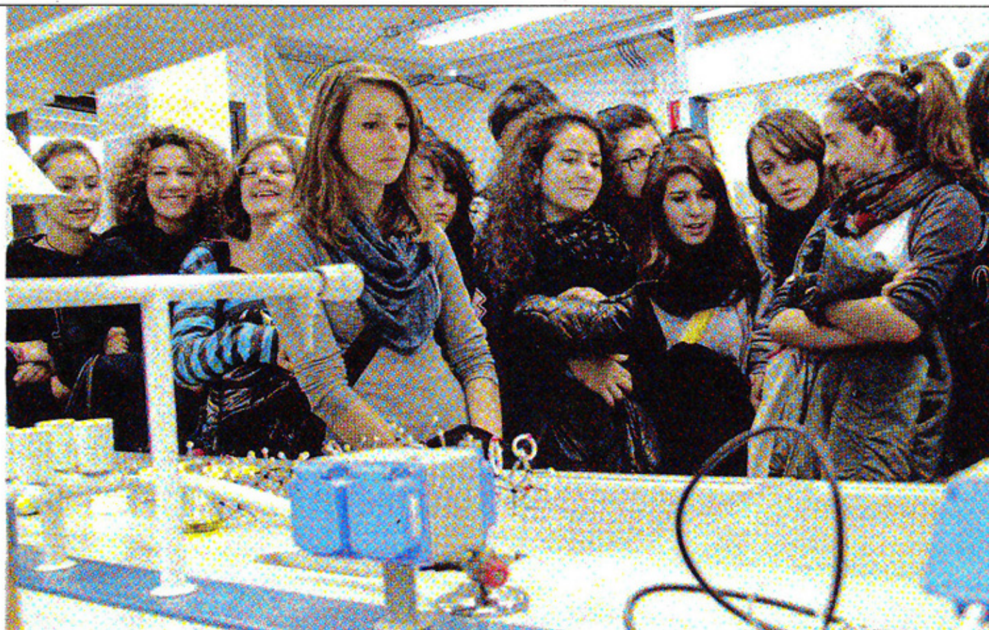
Istituto Fermi: un gruppo di studentesse in uno dei laboratori del liceo tecnologico della Cinciana